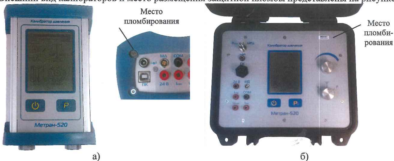
Рисунок 1 – Калибраторы давления Метран-520:

Внешний вид калибраторов и место размещения защитной пломбы представлены на рисунке 1.